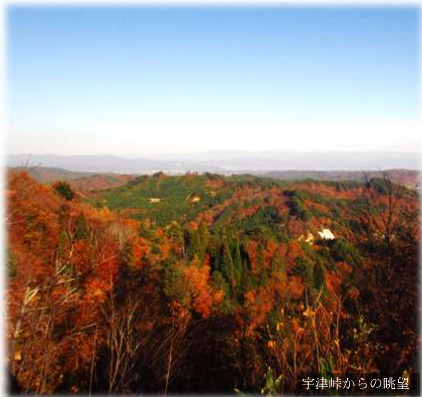
宇津峠からの眺望

「歴史の道百選」、「日本風景街道」に登録され、イギリスの女性探検家イザベラ・バードの旅行記の舞台にもなった越後米沢街道・十三峠を全四回に渡りトレッキングするシリーズ。