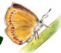
チョウセンアカシジミ